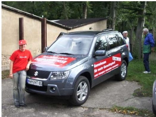
Unser Wahlmobil rollte ab zwei Wochen vor der Wahl täglich durch unseren Landkreis. Die Insassen verteilten Wahlmaterial und für einen kleinen Snack am Gartenzaun oder an der Haustür blieb auch Zeit.

weil es keine Kommunikationszentren gibt, aber der persönliche Einsatz und der Wille unserer Mitglieder, sich den Herausforderungen der heutigen Zeit zu stellen und alles für ein möglichst hohes Wahlergebnis der eigenen Partei entsprechend seiner Möglichkeiten zu tun blieb leider teilweise sehr hinter meinen Erwartungen zurück.